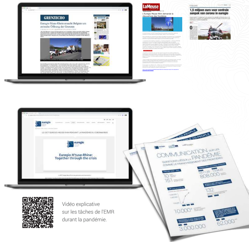
Vidéo explicative sur les tâches de l'EMR durant la pandémie.

La tâche de l'EMR était d'aider la population à s'orienter dans le dédale des différentes mesures et réglementations avec des solutions pratiques.